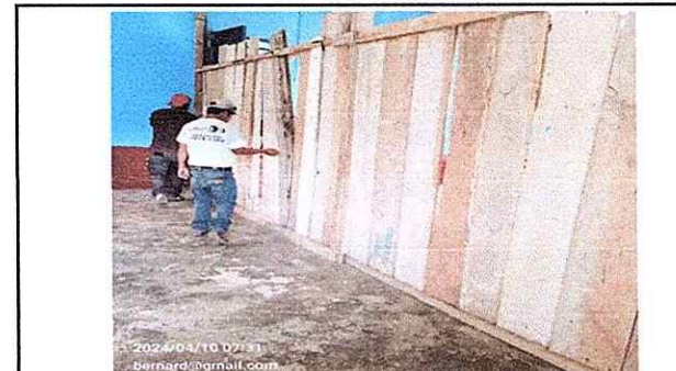
Foto 6: División de madera de las aulas que ocupan los grados de preprimaria y segundo, tercero y cuarto primaria, que serán reemplazadas con una división metálica que garantice la seguridad de los

Observación: Si es necesario se pueden agregar hojas adicionales y actualizar el número de hojas.