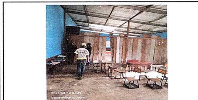
Foto 5: División de madera que representa riesgo en la integridad física de los estudiantes, se encuentran en mal estado e instalación inadecuada.