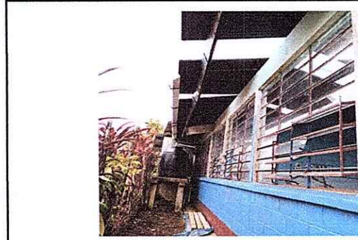
Foto 2: Se evidencia los daños que causó los fuertes vientos en cuanto al entechado del centro educativo.