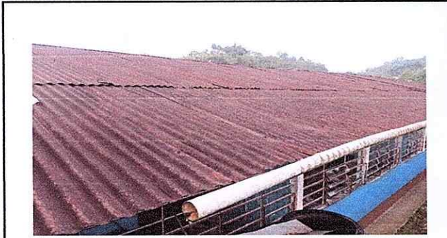
Foto 1: El canal plástico pvc que abastece el depósito de agua en el centro educativo se encuentra en mal estado, afectando a la población estudiantil, en cuanto a los servicios sanitarios y preparación de alimentos.